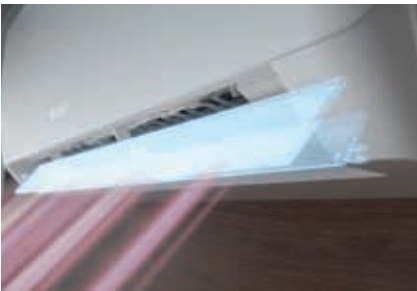
Çift kanallı hava çıkışı