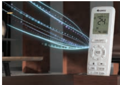
10 dakikada bir uzaktan sıcaklık algılama