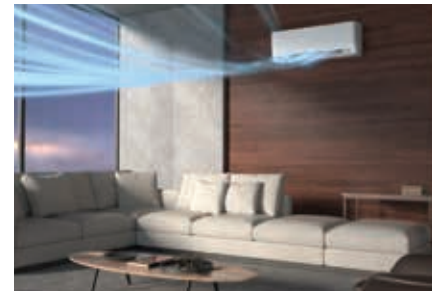
Yukarıdan aşağı soğutma