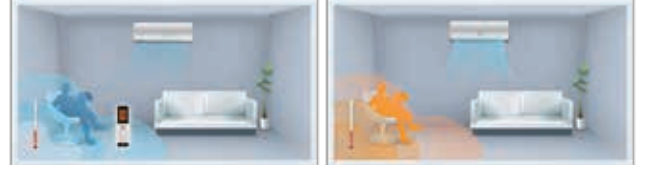
"I Feel" özellikli kumanda

"I Feel" düğmesine basıldığında kumanda üzerindeki sensör ortam sıcaklığını hisseder ve iç üniteye sinyal gönderir. Böylece klima hava üfleme debisini ve sıcaklığını en üst düzeyde konfor sağlayacak şekilde düzenler.